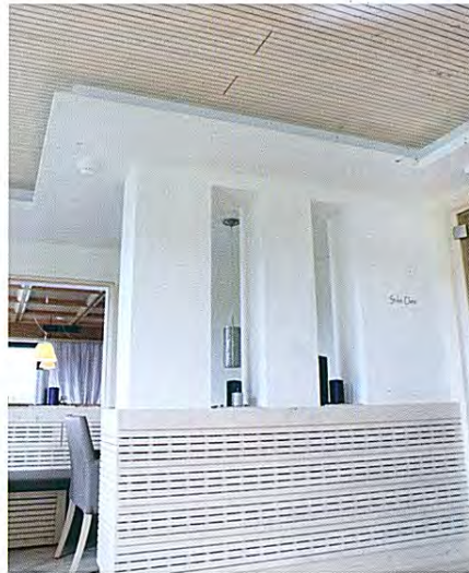
Die schallabsorbierende Decken- und Wandverkleidung ist im Gegensatz zu vielen marktüblichen Akustikverkleidungen absolut ökologisch, recyclebar, aus nachwachsenden Rohstoffen und frei von emittierenden Stoffen.

lenofon ist eine schallabsorbierende Decken- und Wandverkleidung aus feinjähigem Fichtenholz für Neubau und Sanierung, welche sich vor allem durch baubiologisch hochwertige Qualität und nachhaltige Funktionalität auszeichnet. In Kombination mit ökologischen Dämmstoffen (Hanf- und Holzfaserplatten) gelingt es lenofon, die Nachhallzeit zu reduzieren und Geräusche zu dämpfen. Durch die hervorragenden Akustikwerte steigern sich die Raumatmosphäre und somit auch das persönliche Wohlbefinden. Das schönend getrocknet und fachgerecht verarbeitete Massivholz strahlt wohlige Wärme aus und verleiht Räumlichkeiten ein modernes, naturverbundenes Ambiente. ■