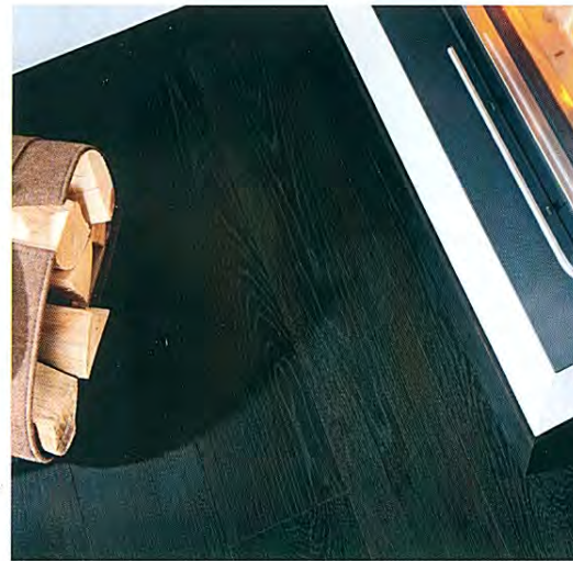
Tiefschwarz, samtig matt und warm in der Haptik: Die Landhausdielen »Eiche Carbonschwarz« von Haro.

Die Landhausdielen »Eiche Carbonschwarz« erhält ihre satte schwarze Farbe mittels eines von Hamberger speziell entwickelten Produktionsverfahrens. Dabei wird der Deckbelag komplett durchgefärbt. Im Vergleich zu gebeizten Hölzern mit ähnlichem Farbton sind deshalb bei