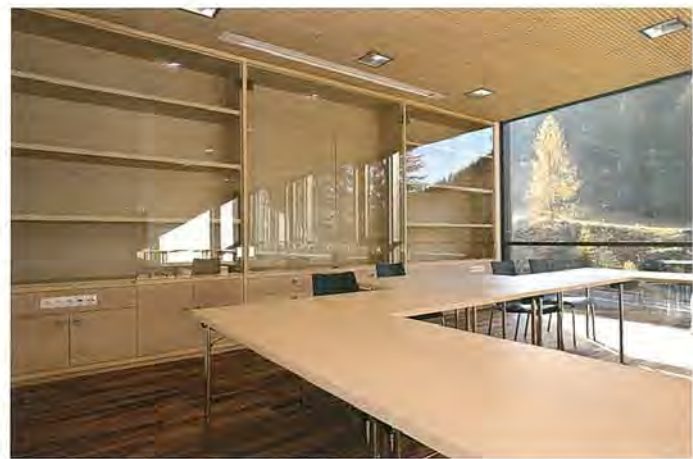
Bild 2. Raum mit schallabsorbierender Decken- und Wandverkleidung